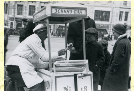
Gadesalg i Moskva

Det sidste blev sagt i et højtideligt Tønefald, der havde været en kongelig Kroningsceremoni værdigt. Hvad der herefter fulgte, vil blive husket længe i den samlede Danske Pressestand. Endnu en Fanfare blev spillet, og herefter marcherede 5 Kokke paa Række ind i Salen, hver slæbende paa en kæmpe mæssig Gryde fyldt med rygende varm Forloren Skildpadde. Alle fik hældt en stort portion op paa deres Tallerken, og der blev desuden skænket godt op i Snapseglassene.