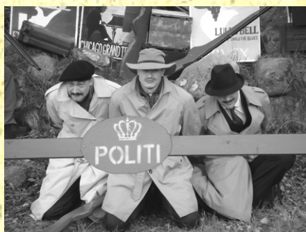
Bandemedlemmer fanget af Agenter

else med Bandens indsmugling af Sprit. Ved flere store Aktioner er det lykkedes Agenterne at fange de fleste Bandemedlemmer, men aldrig selveste „Skalle-