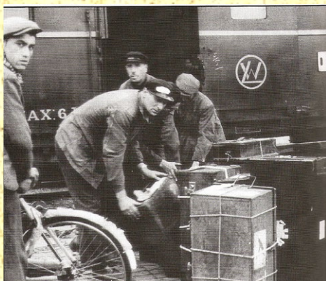
Bagage samles efter Togrøveriet

I samme øjeblik dukkede en Gruppe Mænd op, alle overlæssede med Skydevaaben. Personalet blev tvunget ud af Toget, og bagbundet. Herpaa blev Passagererne, hvoraf flere var kommet lettere til Skade pga. omkringflyvende Bagage, skubbet sammen i Togkorridoren og frarøvet alt af Værdi.