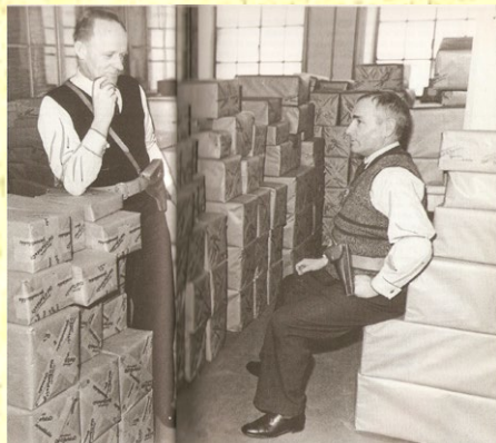
Franske Gendarmere bevogter Lageret af beslaglagt Sprængstof.