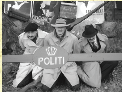
Bandemedlemmer fanget af Agenter