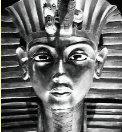
Det var denne Dødsmaakee, der forsvandt fra Hotellet i Cannes.