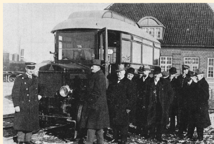
Billede Øverst: De forfølgende Politi Agenter foran Skinneomnibussen. Nederst: Alfaro banden i det kabrede Tog.

Trods intens eftersøgning i Omraadet, er der ingen Spor af Trykkeriet, saa Soldater-Gendamerne antager, at det er ført ud af Landet. Andre Efterretninger fra São Paulo i Brasilien faar Dansk Politi til at frygte, at Trykkeriet med Skib er paa Vej mod Europa.