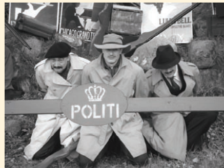
Bandemedlemmer fanget af Agenter