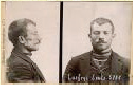
„Det borende X“