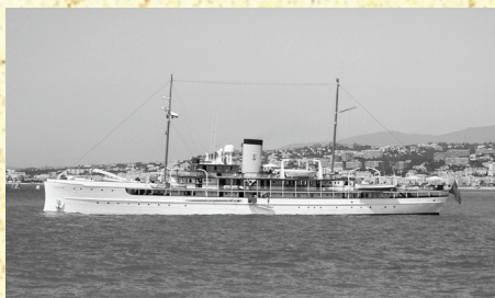
Den imponerende „SS Delphine“