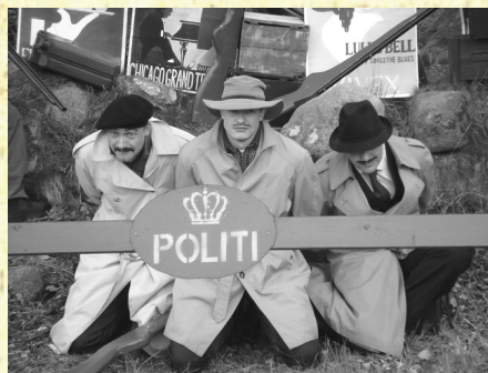
Bandemedlemmer fanget af Agenter